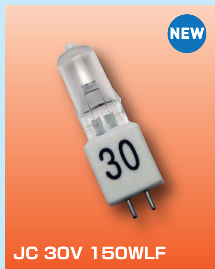
JC 30V 150WLF