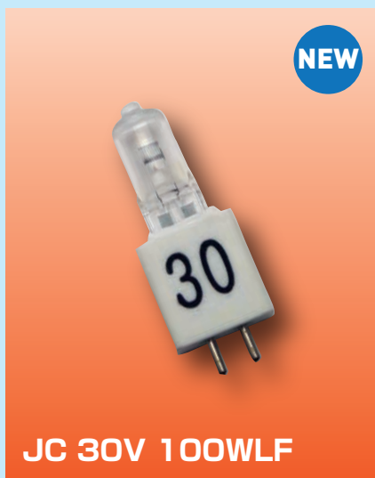
JC 30V 100WLF